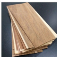
Lâminas Naturais de Madeira