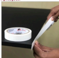
Fixação de Fitas de Borda