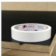
Engrosso de Madeira